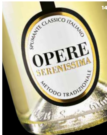
14. VILLA SANDI Opere Trevigiane Serenissima Doc Un Metodo classico ottenuto da Chardonnay e Pinot nero, indicato per gli aperitivi. villasandi.it