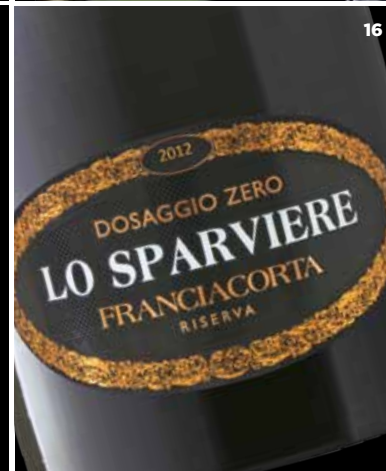
16. AGRICOLE GUSSALLI BERETTA Lo Sparviere Un Franciacorta minerale e molto sapido. losparviere.com