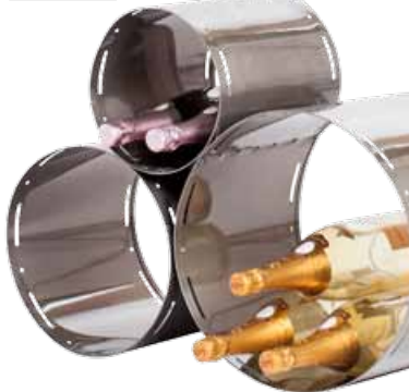
ALEDIVINO Portabottiglie a cilindri modulabili in metallo. Capacità massima 30 bottiglie. aledivino.it

la vendita. Quanto alla Docg, ha frenato il fenomeno dell' italian sounding . I controlli sono più serrati e severi. È un bene per tutti, produttori e consumatori» conclude.